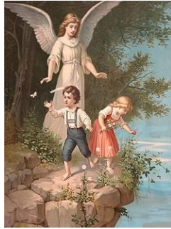
Рис.4 Ангел – хранитель

независимо от того, верующий ты или атеист. Много религиозной литературы издано об Ангелах, но хочу рассказать о своём опыте.