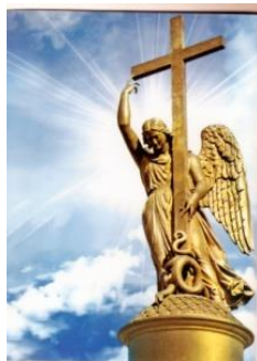
Рис.5 Ангел на Александровской колонне в Санкт-Петербурге

Е.Березиков напоминает, что Ангел на колонне, выполняет роль Оберега Северной Столицы Святой Руси.